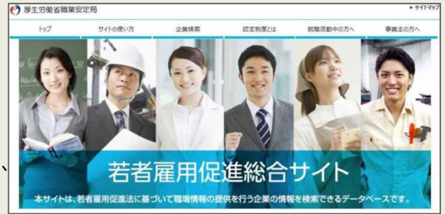
「若者雇用促進総合サイト」

個別企業ごとに企業概要、雇用管理の状況、求職者に向けたメッセージなどを掲載することで、積極的な企業情報の発信と若者とのマッチングを促進していきます。